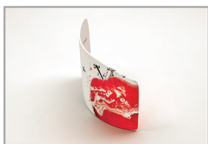
Impression recto / verso ou recto seul