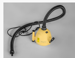
Pompe électrique ou manuelle