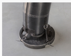
Poids de lestage